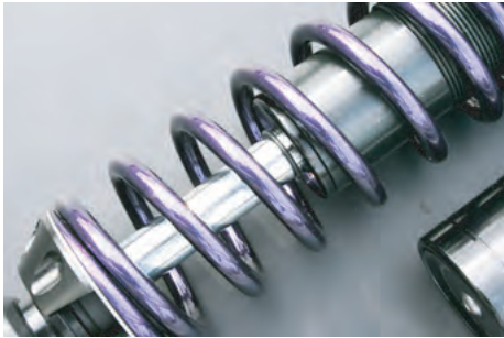
バイオレットパープル (VP)