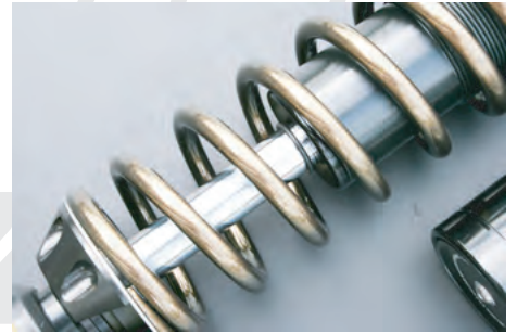
カスタムガンメタ (G)